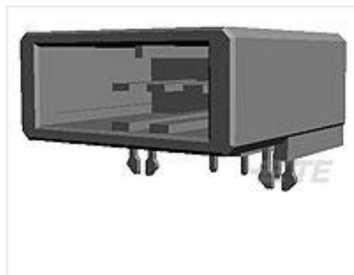
TE 产品编号2-2013519-0 DYNAMIC D3900 H-HDR ASSY 10P Y TYPE-A