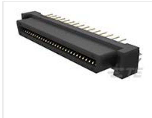
TE 产品编号3-5175475-5 CHAMP 050 B/B REC V W/LEG 40P