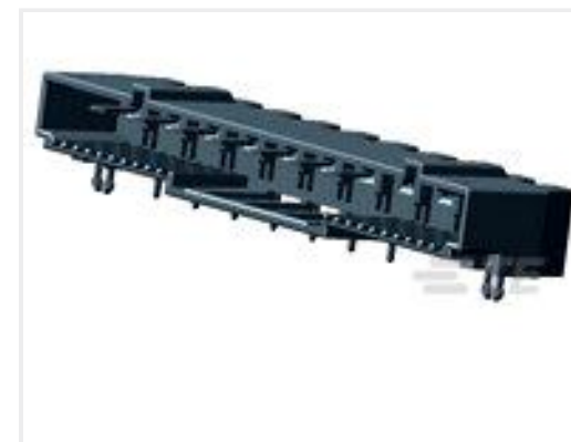
TE 产品编号1-2229803-2 D3950 HDR 7/11POS 1ROW Y KEY