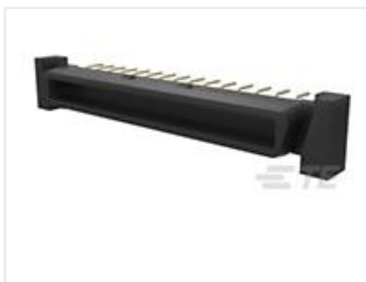
TE 产品编号5917629-5 AMP FH REC V 120P H-9 SIF