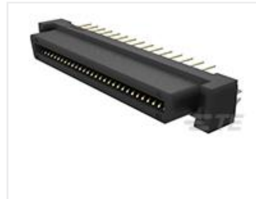
TE 产品编号3-5175475-7 CHAMP 050 B/B REC V W/LEG 60P