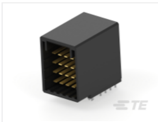
TE 产品编号CAT-D9934-A75H Dynamic 3400F HDR 组件