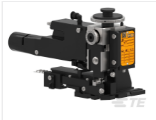
TE 产品编号2837892-2 OCEAN-2.0-APPLICATOR-S-046F053F- SSA