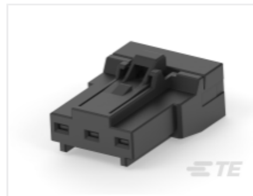
TE 产品编号3-2134249-3 D3900S 7.5MM PITCH REC ASSY 3P BLACK Z