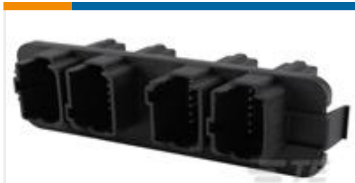
TE 产品编号DT13-48PABCD-R015 HDR, 48P, BLK, RA EEC, NI/CU, ABCD