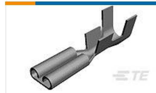
TE 产品编号5-160430-7 187 FASTON REC 20-16 AWG TPBR