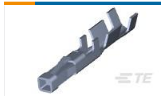
TE 产品编号1-794606-1 MICRO MNL RPT CNT STRP 15AU LF