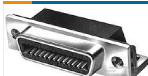
TE 产品编号5553813-3 ASSY,EMI RCPT,50 POSN,SCR LK