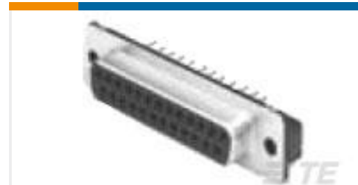
TE 产品编号1-5747150-4 09 RCPT SP/FMS SCRLK