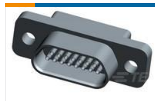
TE 产品编号1532172-3 M83513/04-B03N, MCKS-N1-B-15S6G9-18.0