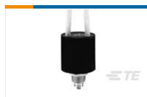
TE 产品编号4-1618276-3 K62A741=RELAY, VACUUM, SPST-NO