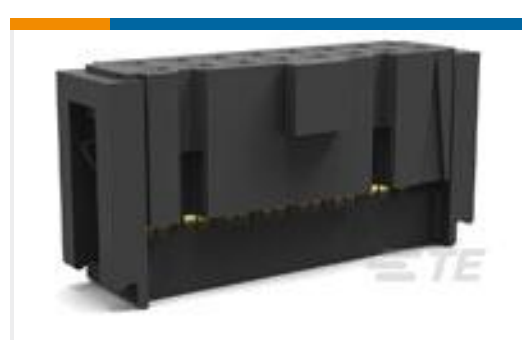
TE 产品编号1658527-9 622-2630LF FEM SOCKET, LEAD FREE