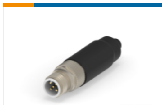
TE 产品编号1-2823449-2 M12 A-M-5, CAT 5 RADOX 7.3MM, H&S