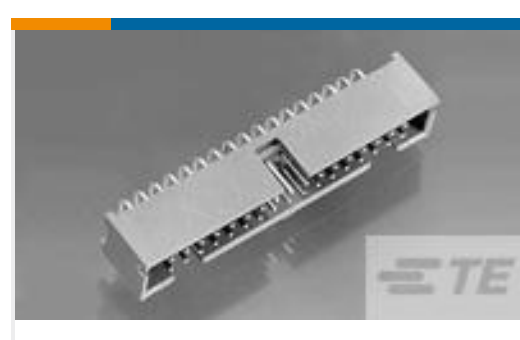
TE 产品编号1761682-3 IDC LOW PRO HDR 10P RA HT BLACK