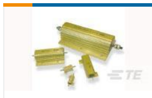
TE 产品编号2-1625999-3 HSC100 2K0 5%