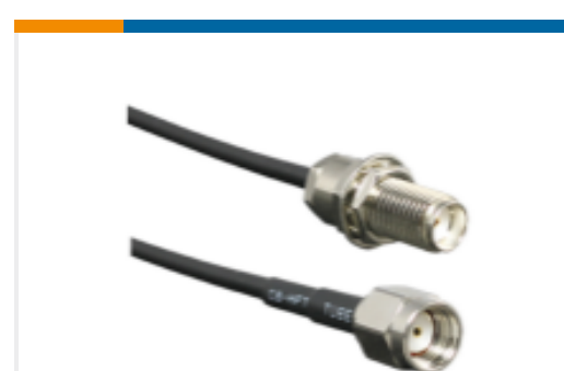
TE 产品编号CSA-SMAM-216-SAFB SMA to SMA 216mm RG174