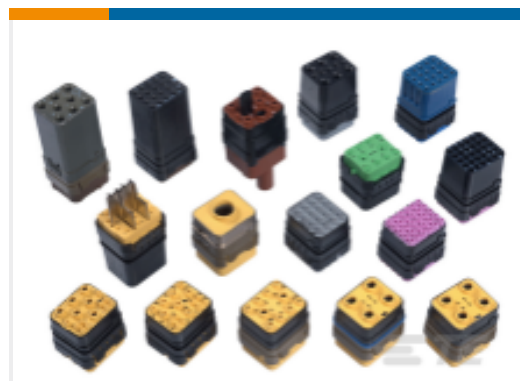
TE 产品编号ZPF00000000148762 DMC-M 99-04 AN (=33537-P0000)