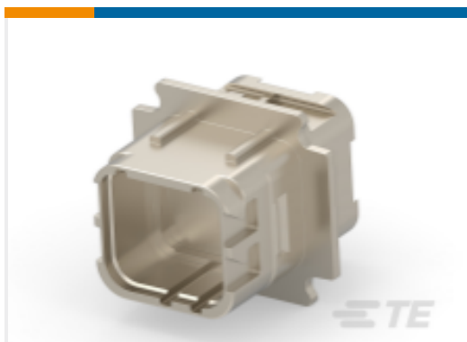
TE 产品编号ZPF00000000146309 Rectangular Connector Receptacle Extenders, Tool-less Assembly