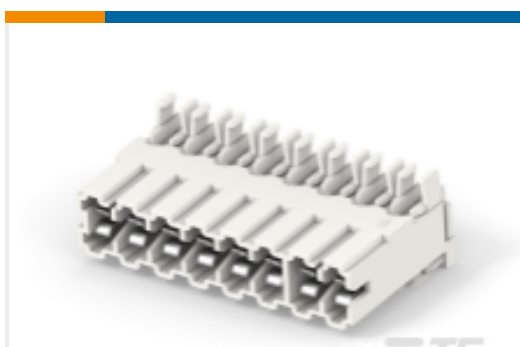
TE 产品编号2293372-8 AMP MONO-SHAPE PCB CONN