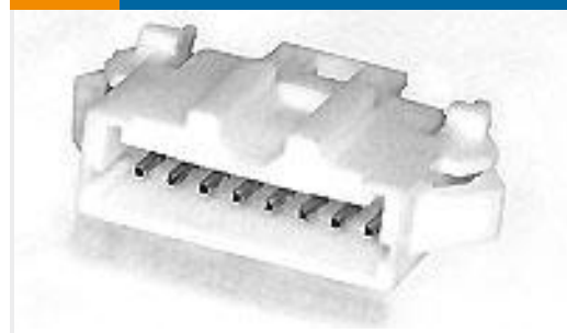
TE 产品编号292215-2 MINI CT SGL RELAY 2P NAT