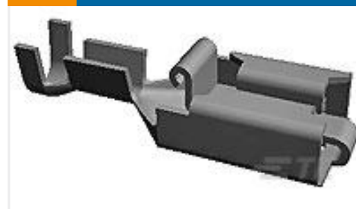
TE 产品编号154717-6 PL 250 REC TERMINAL 14-11 AWG PTPB