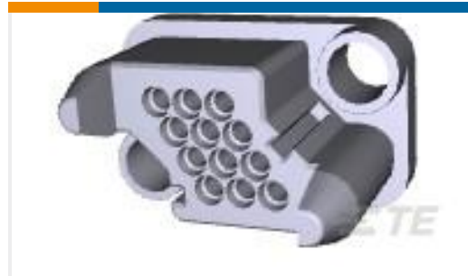
TE 产品编号211758-1 PLUG HSG,12 POSN,METRIMATE