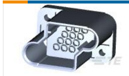
TE 产品编号211759-1 RECEPT HSG,12 POSN,METRIMATE