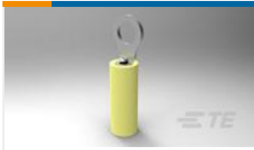
TE 产品编号323912 TERMINAL,PIDG R 26-22 2