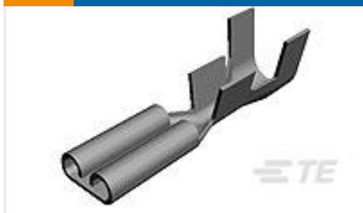
TE 产品编号61368-1 250 FASTON REC 24-20 AWG TPBR