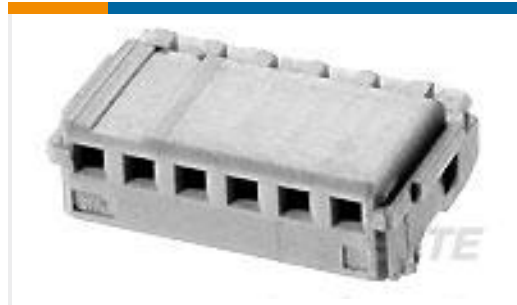
TE 产品编号353908-3 CT REC HSG 3P CRIMP TYPE WHITE