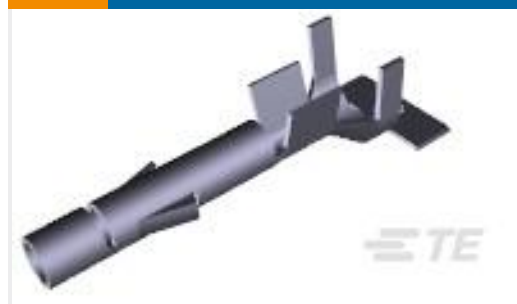
TE 产品编号926869-3 UNIV-MNL SOCKET 1