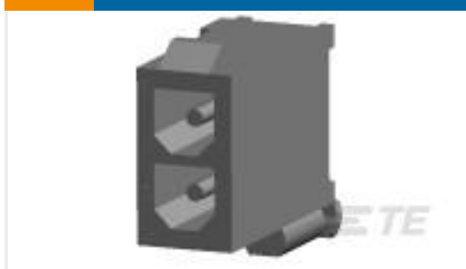
TE 产品编号1-770166-1 02P MINI UMNL ASSY VO SNAU LF