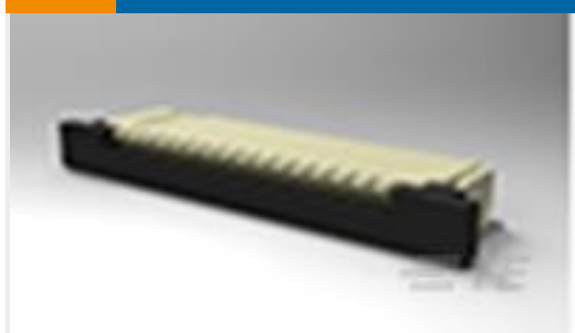
TE 产品编号84953-6 1MM FPC HORZ.TOP CONT.ASSY 6P