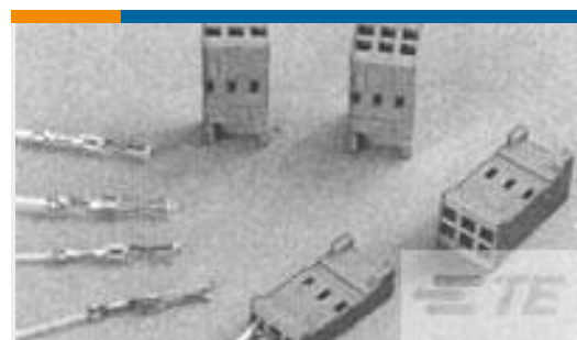
TE 产品编号 1-281839-2 HOUSING HE13 HE14 COSI 2X12 P