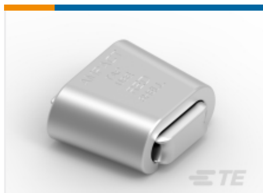
TE 产品编号600530 AMPACT TAP ASSY