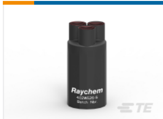
TE 产品编号000938N001 402W526/S(S5)