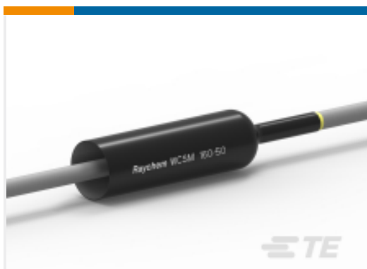
TE 产品编号CU8546-000 厚壁热缩管