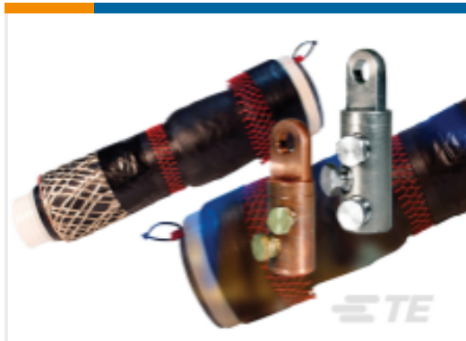
TE 产品编号FG1538-000 冷缩可拆卸接头