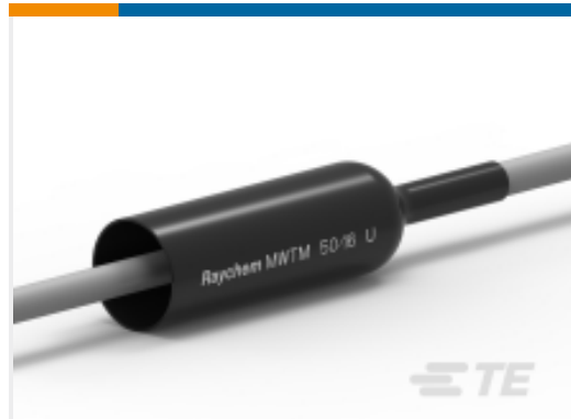
TE 产品编号035001-000 MWTM-50/16-A/U-4(S25)