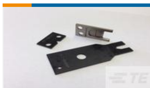
TE 产品编号2217206-8 Blade, Slug