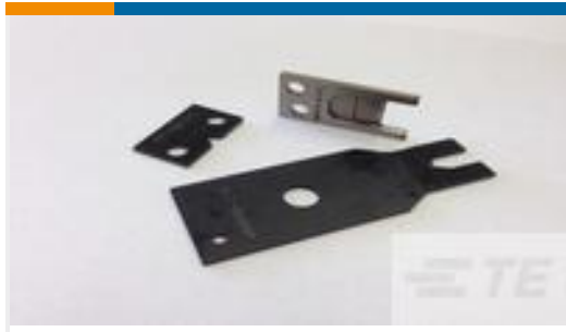
TE 产品编号9-240651-1 BLADE, SLUG