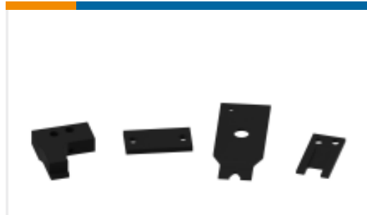
TE 产品编号240642-1 PLATE, FRONT SHEAR