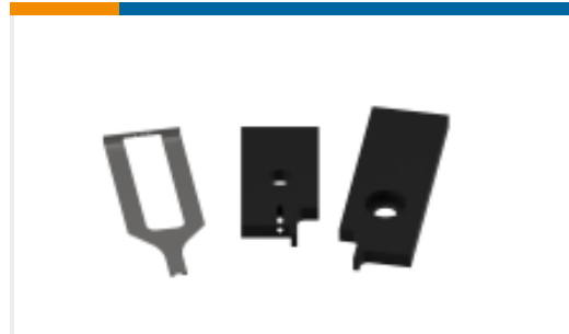
TE 产品编号2119791-5 Depressor, Wire