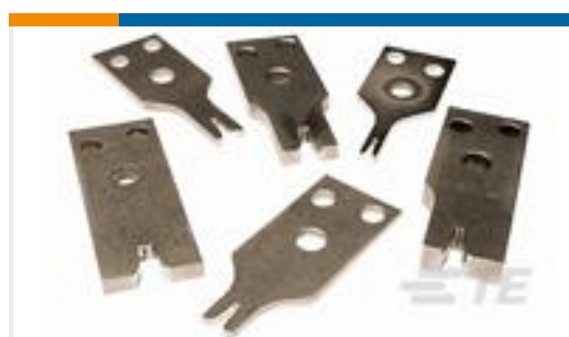
TE 产品编号2-459736-4 CRIMPER, WIRE "F" SPLICE TYPE