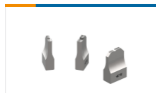
TE 产品编号4-1333206-8 ANVIL, COMBINATION (.100)