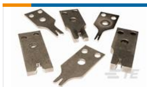
TE 产品编号3-1633965-8 INSULATION CRIMPER