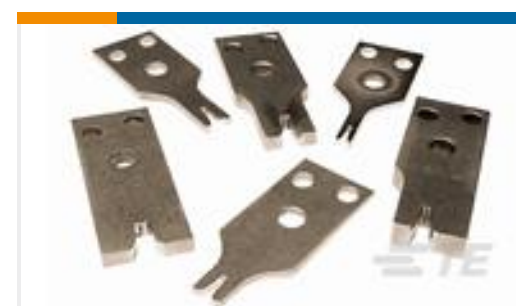
TE 产品编号2119785-3 CRIMPER, INSUL OVERLAP PREM