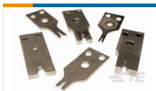
TE 产品编号1-456403-3 CRIMPER WIRE .062 F