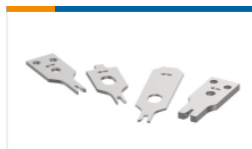
TE 产品编号1-1633773-6 CRIMPER, WIRE F, STEP