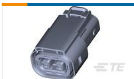
TE 产品编号4-2103177-5 PLUG ASSY, KEY E, FA,CPA, HVA280-2PHI XE