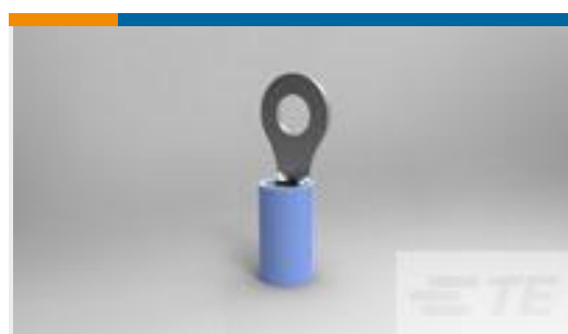
TE 产品编号2-320560-1 TERMINAL,PIDG R 16-14 8, TAPE