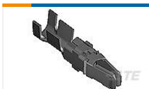
TE 产品编号1-66740-1 TYPE XII FEMALE CONT (STRIP)