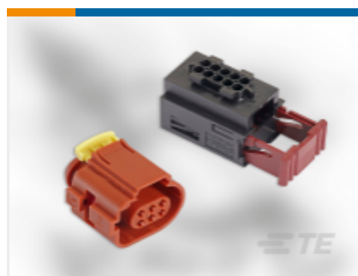
TE 产品编号1-967627-4 Timer Connector Housing