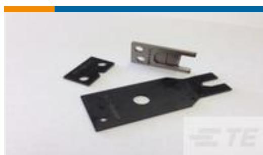
TE 产品编号4-240651-2 BLADE, SLUG