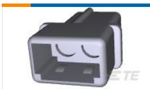
TE 产品编号1-480319-9 02P CMNL CAP HSG F/H BLK