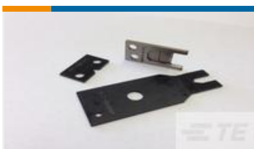
TE 产品编号2217206-1 Blade, Slug