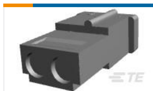
TE 产品编号1-480318-9 02P CMNL PLUG HSG F/H BLK