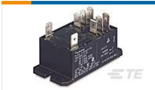
TE 产品编号1-1393212-7 T92S7D22-24