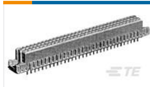
TE 产品编号5535070-5 ASSY,RECEPTACLE,EUROCARD,TYPE