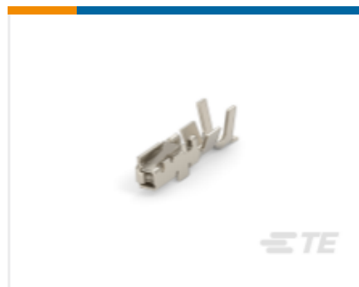
TE 产品编号2367817-2 DYNAMIC D1000 SL REC CONT M SIZE Au0.2