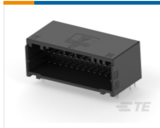
TE 产品编号1-2372488-4 DYNAMIC 1100D HDR ASSY H 28PX Pre-TIN