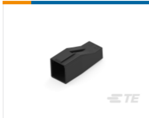
TE 产品编号1-2366600-4 DYNAMIC D1000 SLIM TAB HSG 4P X KEY