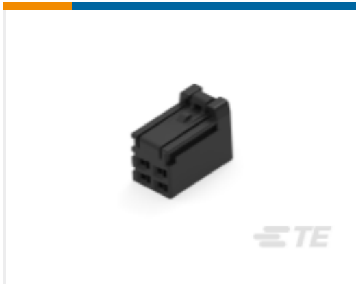
TE 产品编号1-2366515-4 DYNAMIC D1000 SLIM REC HSG 4P X KEY