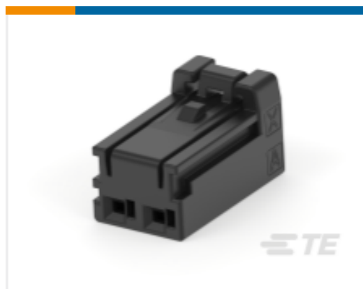
TE 产品编号1-2375948-2 DYNAMIC D1000 SLIM REC HSG 2P X KEY