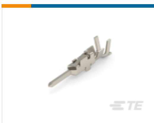
TE 产品编号2367819-2 DYNAMIC D1000SL TAB CONT M AU0.2 PLATING