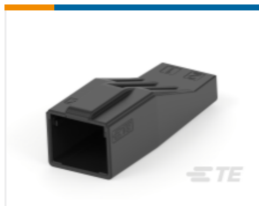
TE 产品编号1-2375951-2 DYNAMIC D1000 SLIM TAB HSG 2P X KEY