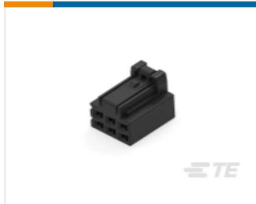
TE 产品编号1-2366515-6 DYNAMIC D1000 SLIM REC HSG 6P X KEY