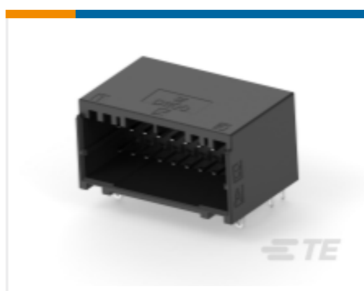
TE 产品编号1-2379284-0 D1100 HDR ASSY H 20P XBLACK PRE-TIN