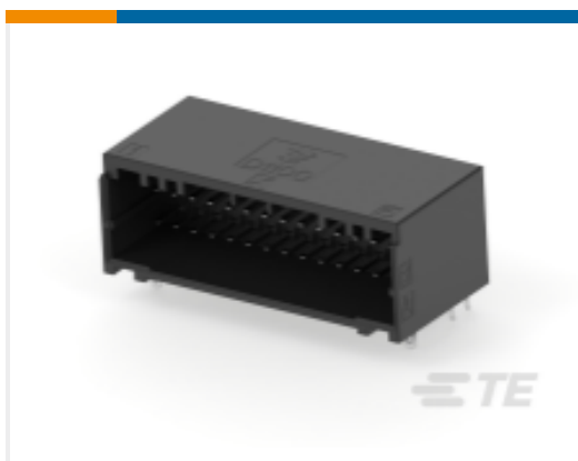
TE 产品编号1-2372488-5 DYNAMIC D1100D HDR ASSY H 30PX Pre-TIN