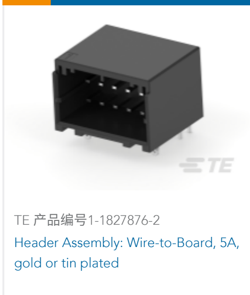
TE 产品编号1-1827876-2 Header Assembly: Wire-to-Board, 5A, gold or tin plated