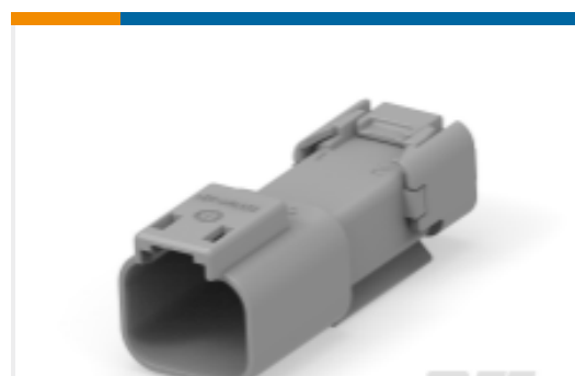
TE 产品编号1-2322907-2 DT04-2P-TR31-4700, REC,2P,GRY, SNAPCAP,AU