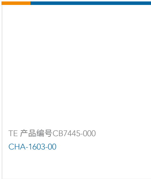
TE 产品编号CB7445-000 CHA-1603-00