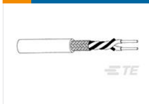
TE 产品编号008735-000 0024G0024-9X