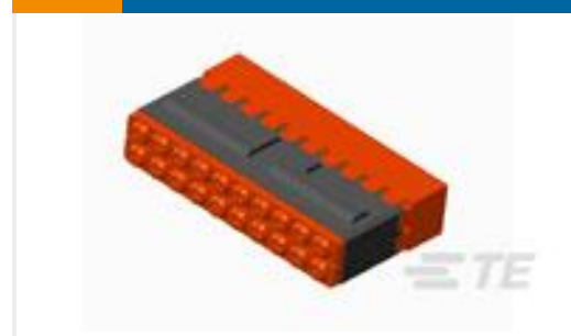
TE 产品编号850957-000 MTCP-122-20PQ