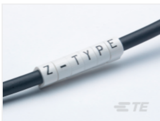
TE 产品编号 EC0271-000 05813409