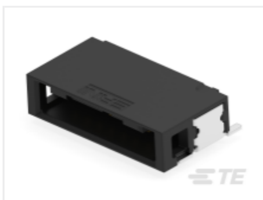
TE 产品编号 524141-E MCBA 8 M * SMD 137 * 176 * GURT C8J 2 5