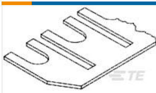
TE 产品编号5-1437644-4 J8-2=J8-XX JUMPER