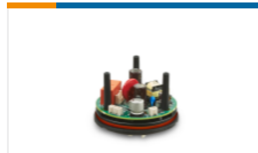
TE 产品编号2314786-1 LUMAWISE N ENHANCED BASE, FM ON, ZC YES