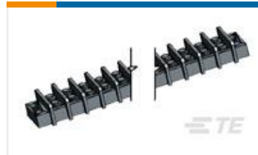
TE 产品编号1-1546670-8 18P.437" DR BARRIER,W/BND SCRW