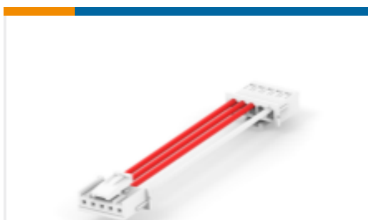
TE 产品编号2318044-1 CABLE ASSEMBLY, EB, SK5 POS EP 2P5