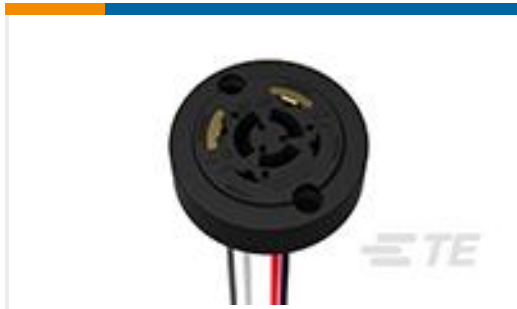
TE 产品编号2213362-2 Rcpt Assy,Dimmable Photocontrol, 150C,3/4