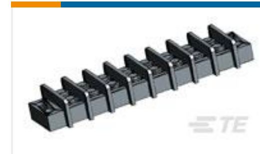
TE 产品编号1546670-8 8P .437" DR BARRIER,W/BND SCRW