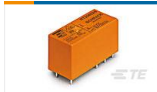
TE 产品编号7-1393243-8 RT424615