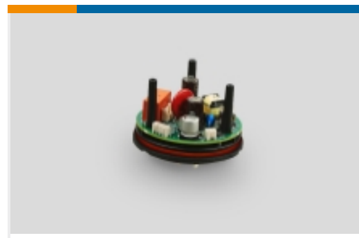
街道照明电源管理(6)