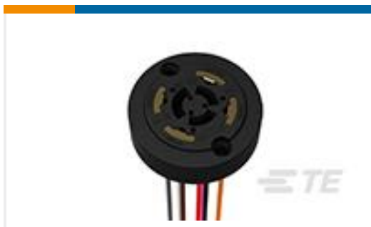
TE 产品编号2213362-4 RCPT ASSY,DIMMABLE PHOTOCONTROL,105C,3/4