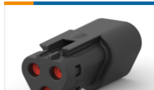
TE 产品编号1-2303813-3 DT04-3P-TN32, REC, 3P, BLK, N, SNAPCAP