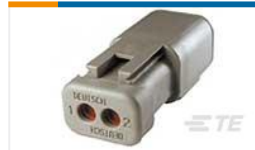
TE 产品编号DTP04-2P-E003 REC, 2P, GRY, N, CAP