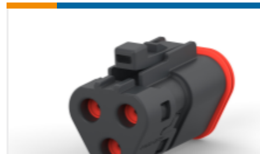
TE 产品编号1-2303816-4 DT06-3S-TE32, PLG, 3P, BLK, E, SNAPCAP