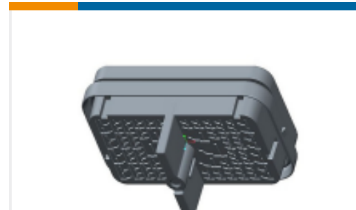
TE 产品编号DRB12-102PAE-L018 REC, 102P, BLK, E, CAP, A