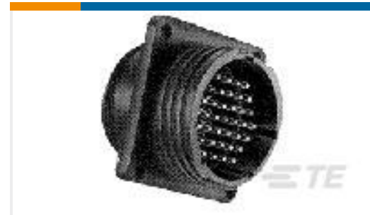
TE 产品编号206061-2 CPC RECPT ASSEMBLY SIZE 11-4