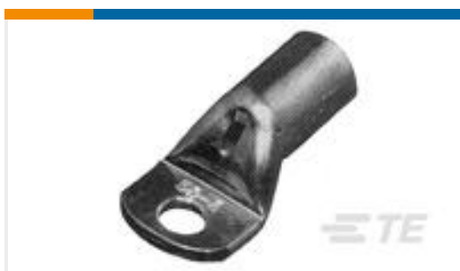
TE 产品编号710032-2 XCT 6-5