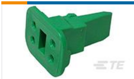
TE 产品编号W4S-P012 WEDGE LOCK, 4P, PLG, GRN, SL RET, DT