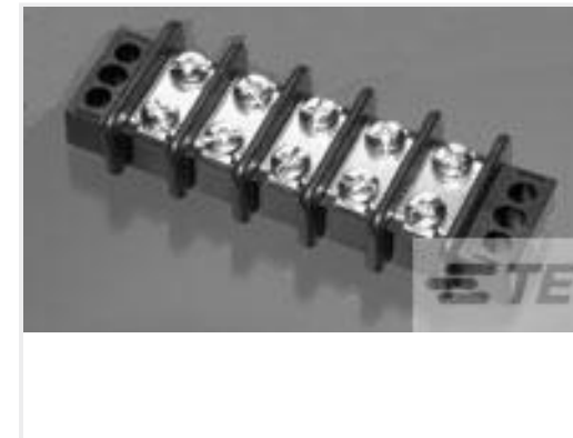
TE 产品编号1546307-2 2P .374" DR BARRIER,W/WASHER