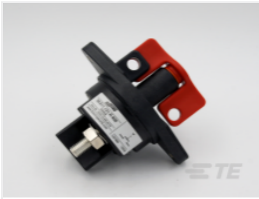
TE 产品编号K1156868 Battery Disconnector 35-314-131-R-900