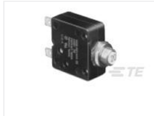
TE 产品编号4-1393249-0 W58-XC4C12A-10=W58