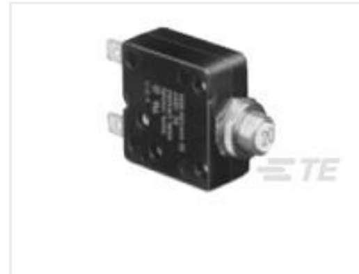
TE 产品编号4-1393249-6 W58-XC4C12A-30=W58