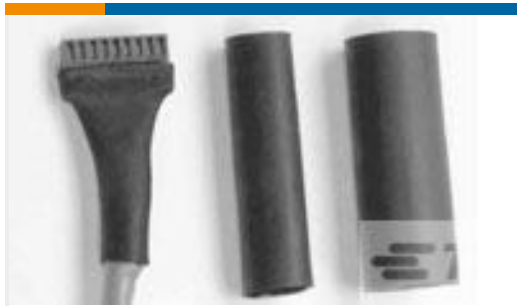
TE 产品编号7580142002 DWP-125-3/8-0-STK