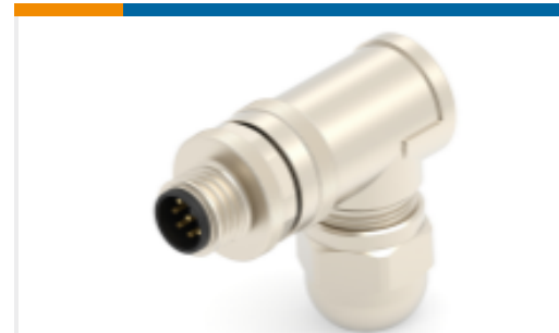
TE 产品编号T4113012081-000 M12 M, 8P GOLD A_CODE RA SHIELDED PG9