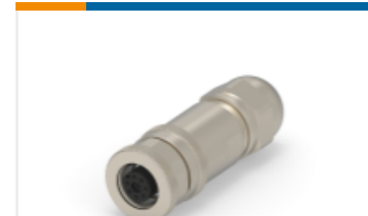
TE 产品编号T4110012081-000 M12 F, 8P GOLD A_CODE S SHIELDED PG9