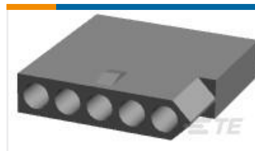
TE 产品编号770083-1 05P .093 COMM P&S RECPT HSG