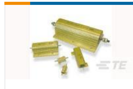
TE 产品编号1630024-1 HSC250 100R 5%