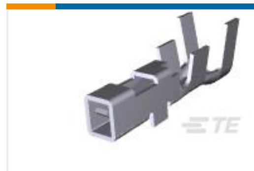
TE 产品编号1827572-2 DYNAMIC D1000 REC CONT 2L AU 0.38um FORM