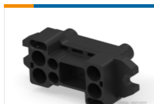
TE 产品编号T2100182101-000 BPSC-12/2/4-M