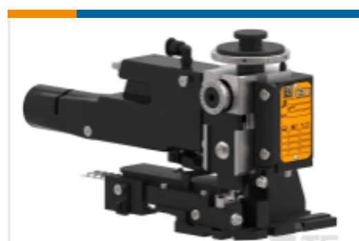
TE 产品编号5-2151494-2 OCEAN_2.0_APPLICATOR-S- 055F055F-RSA