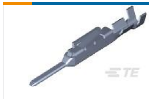
TE 产品编号1318110-1 DYNAMIC D-2000 TAB CONT S