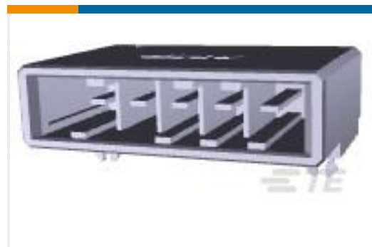
TE 产品编号1-316130-5 DYNAMIC D-3200 HDR ASSY 5P H