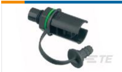
TE 产品编号1394739-1 STECKVERB.ABDECKUNG