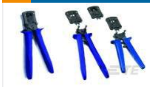
TE 产品编号1-1579004-2 CSV10 CRIMPING HANDTOOL SOLARLOK 4-6