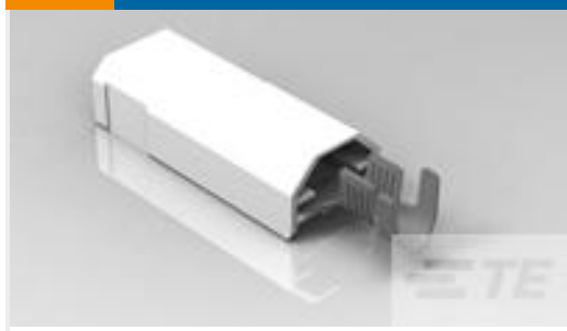
TE 产品编号521227-2 ULTRA-POD 250 ASSY TAB 12-10 AWG TPBR