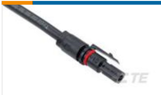
TE 产品编号1987559-1 PHOTOVOLTAIK CONNECTOR, 2.5 sqmm