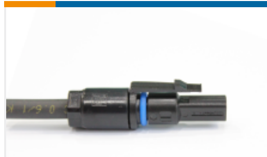
TE 产品编号1-1987559-2 PHOTOVOLTAIK CONNECTOR, 4sqmm