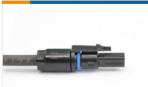
TE 产品编号1-1987559-1 PHOTOVOLTAIK CONNECTOR, 4sqmm