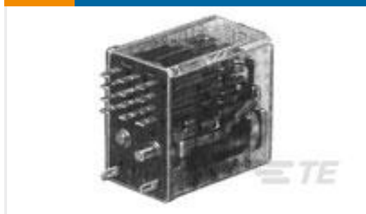
TE 产品编号1393766-3 R10-E1X2-S800=R10