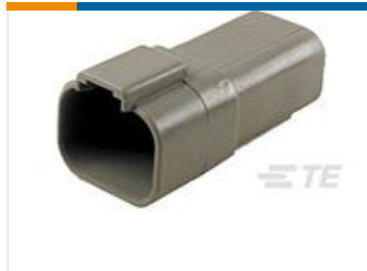
TE 产品编号DT04-4P-C015 REC, 4P, GRY, E