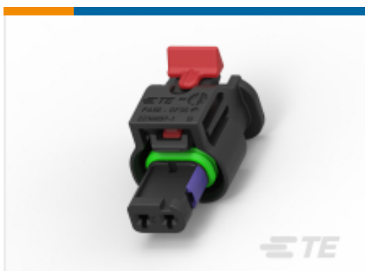
TE 产品编号1-2236896-5 2POS, MCON 1.2 LL REC SEALED