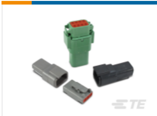
TE 产品编号DTM06-12SD-E007 DEUTSCH DTM Housings