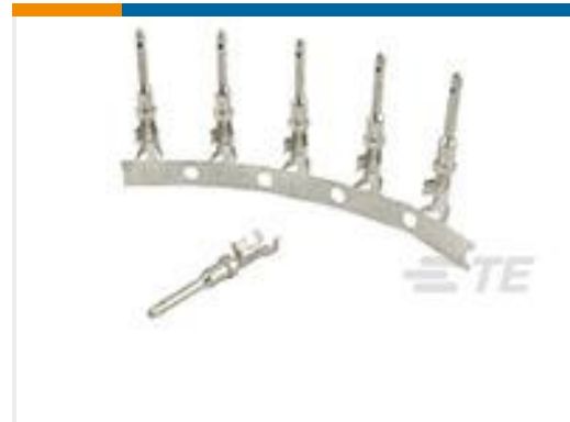
TE 产品编号1060-16-0122 PIN, SF, SIZE 16, 14-18, NI/SN