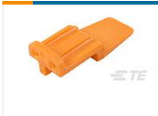
TE 产品编号WM-2S WEDGE LOCK, 2P, PLG, ORG, DTM