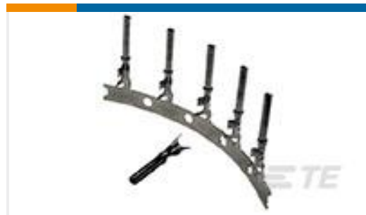
TE 产品编号1062-20-0122 SOC, SF, SIZE 20, 16-22, NI/NI