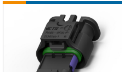
TE 产品编号1-2236343-1 3POS, MCON 1.2 LL REC SEALED