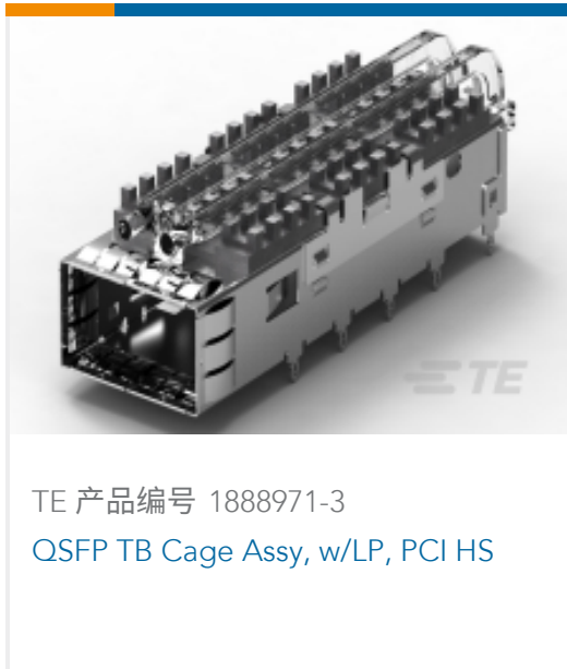
TE 产品编号 1888971-3 QSFP TB Cage Assy, w/LP, PCI HS