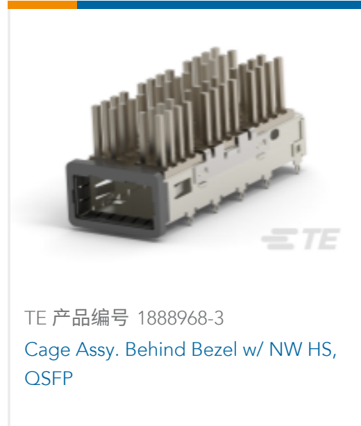
TE 产品编号 1888968-3 Cage Assy. Behind Bezel w/ NW HS, QSFP