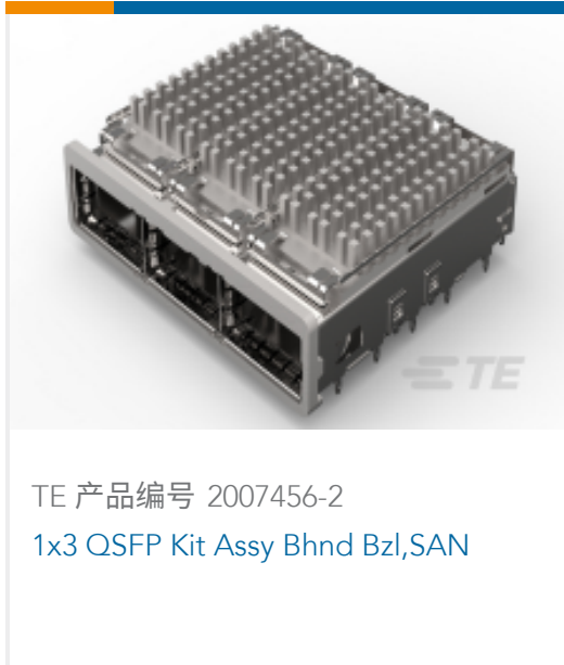
TE 产品编号 2007456-2 1x3 QSFP Kit Assy Bhnd Bzl,SAN EONs