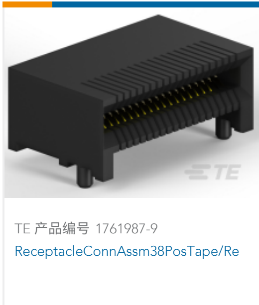
TE 产品编号 1761987-9 ReceptacleConnAssm38PosTape/Re