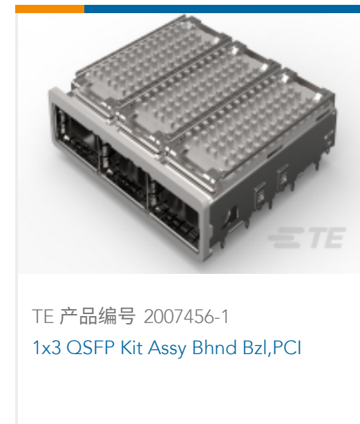
TE 产品编号 2007456-1 1x3 QSFP Kit Assy Bhnd Bzl,PCI EONs