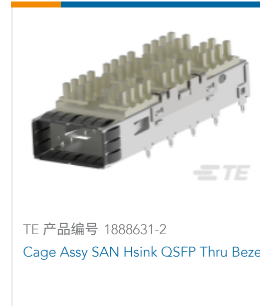
TE 产品编号 1888631-2 Cage Assy SAN Hsink QSFP Thru Bezel