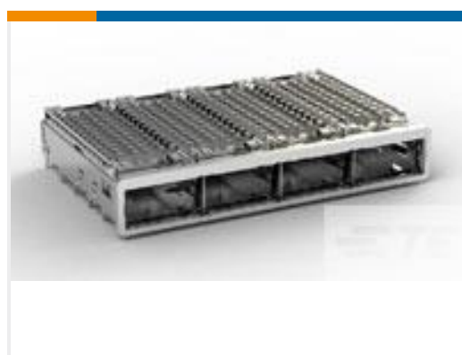
TE 产品编号 2007625-1 1x4 QSFP Kit Assy Bhnd Bzl,PCI