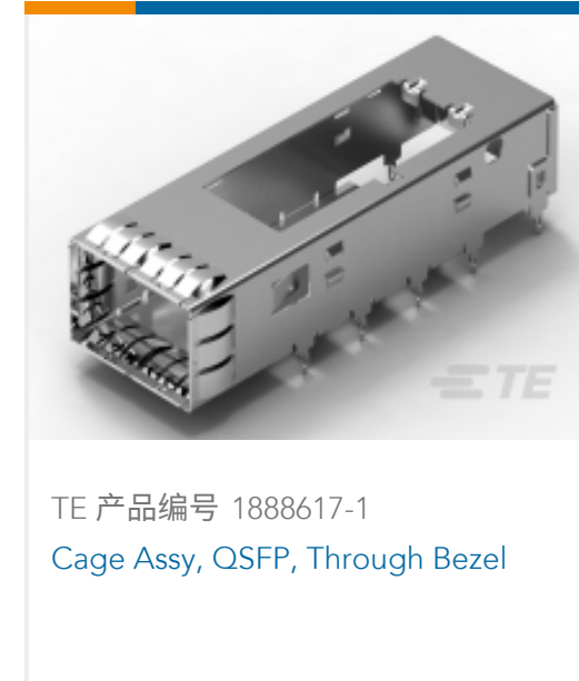
TE 产品编号 1888617-1 Cage Assy, QSFP, Through Bezel