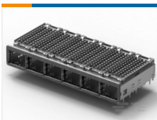
TE 产品编号 2143330-1 1X6 QSFP Kit Assy Bhnd Bzl,PCI