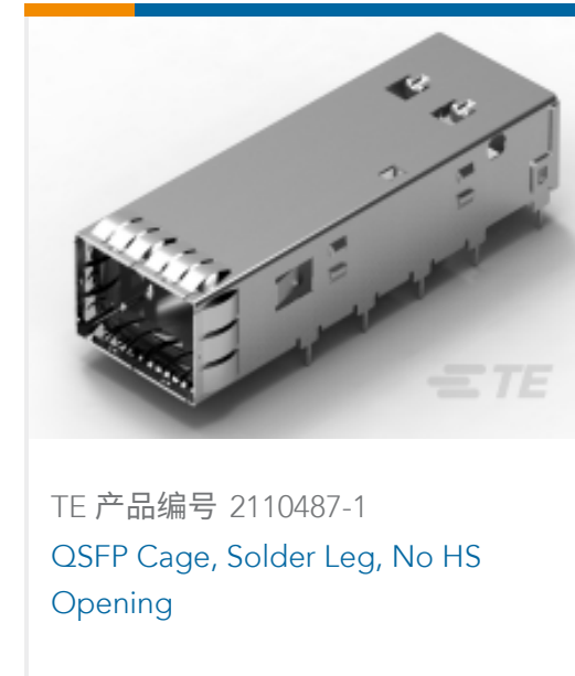
TE 产品编号 2110487-1 QSFP Cage, Solder Leg, No HS Opening