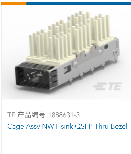
TE 产品编号 1888631-3 Cage Assy NW Hsink QSFP Thru Bezel