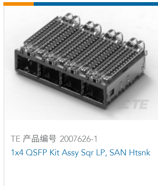
TE 产品编号 2007626-1 1x4 QSFP Kit Assy Sqr LP, SAN Htsnk