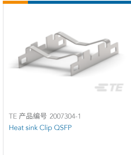
TE 产品编号 2007304-1 Heat sink Clip QSFP