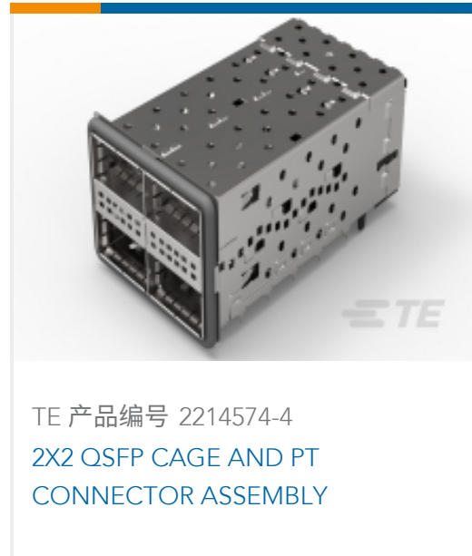
TE 产品编号 2214574-4 2X2 QSFP CAGE AND PT CONNECTOR ASSEMBLY