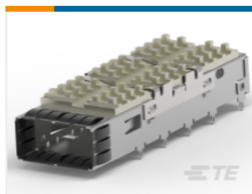
TE 产品编号 1888631-1 Cage Assy PCI Hsink QSFP Thru