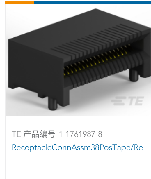
TE 产品编号 1-1761987-8 ReceptacleConnAssm38PosTape/Re