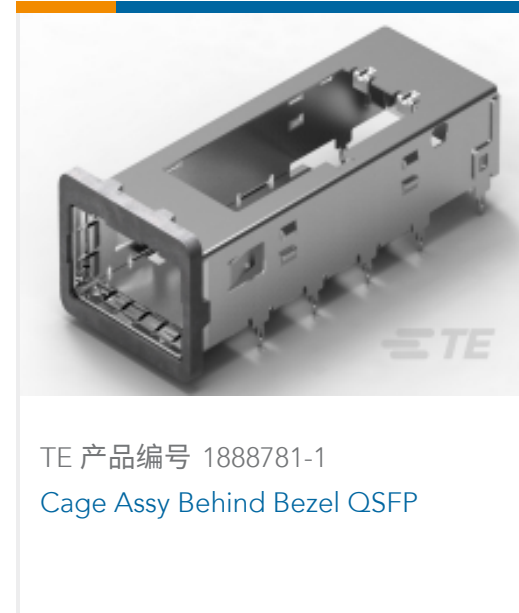
TE 产品编号 1888781-1 Cage Assy Behind Bezel QSFP