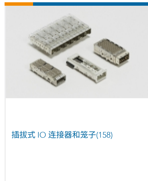
插拔式 IO 连接器和笼子(158)