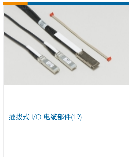
插拔式 I/O 电缆部件(19)