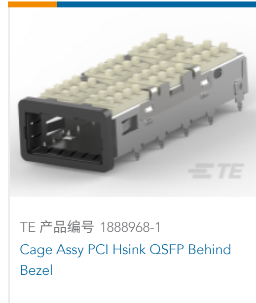
TE 产品编号 1888968-1 Cage Assy PCI Hsink QSFP Behind Bezel