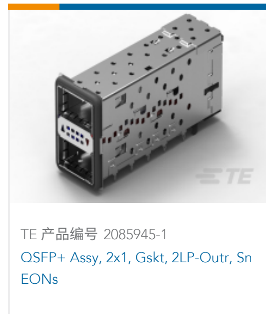
TE 产品编号 2085945-1 QSFP+ Assy, 2x1, Gskt, 2LP-Outr, Sn EONs