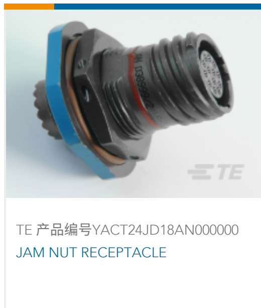
TE 产品编号YACT24JD18AN000000 JAM NUT RECEPTACLE