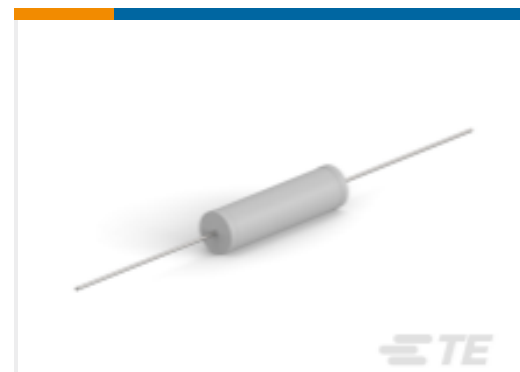
TE 产品编号4-2176414-8 7W STD M/OX 5% 1K8