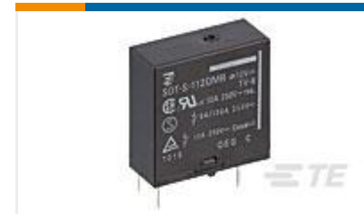
TE 产品编号8-1419125-5 SDT-S-106LMR,000