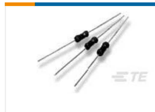
TE 产品编号4-1879350-2 RR01 5% 11R AMMO