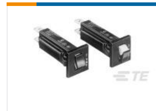
TE 产品编号1-1393250-7 W28-XQAT-15=W28