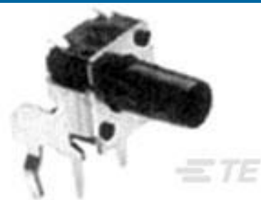
TE 产品编号1825027-5 FSMRA2JH04=R/A, TACT PB SW, 160G