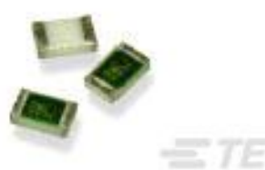
TE 产品编号1-1879417-6 CPF 0603 750K 0.1% 25PPM 1K RL