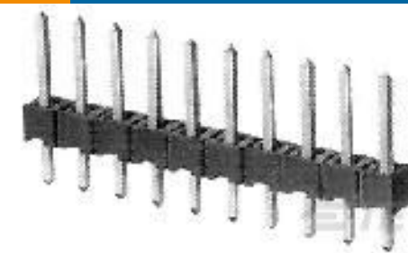
TE 产品编号3-826936-2 32P AMPMODU II STIFT LEI