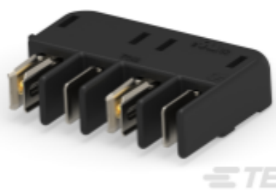
TE 产品编号 1-2213614-2 HERM BLADE & REC, 4 POS, LATCH, SEL GLD, BLK