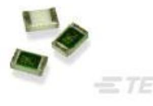
TE 产品编号2-1879061-7 CPF 0402 100R 0.1% 25PPM 5K RL