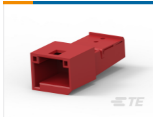
TE 产品编号4-1718353-3 2POS,5.8X0.8,TAB HSG,COD D