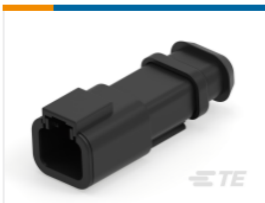
TE 产品编号DTP04-2P-CE09 REC, 2P, BLK, E, XCAP