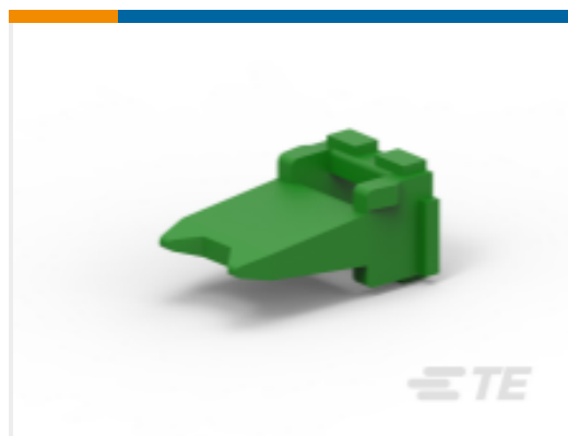
TE 产品编号W4P-P004 WEDGE LOCK