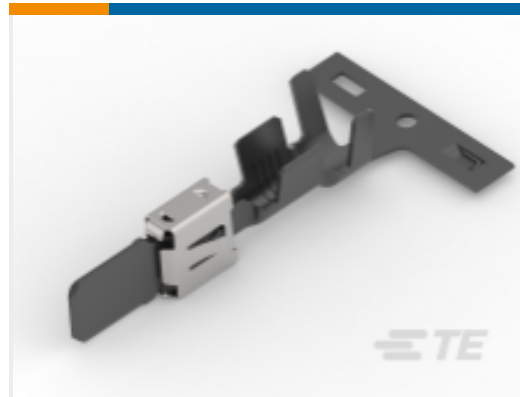
TE 产品编号2-968050-2 TAB 5.8x0.8 CONTACT CF SRC Ag