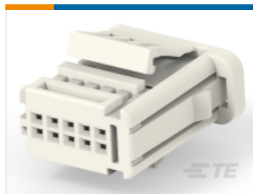
TE 产品编号2208339-2 10POS,NANOMQS,REC HSG,CODB