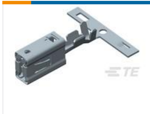
TE 产品编号1-2208459-3 AMP MCP 6.3/4.8K,TERMINAL,FUSE 0.64