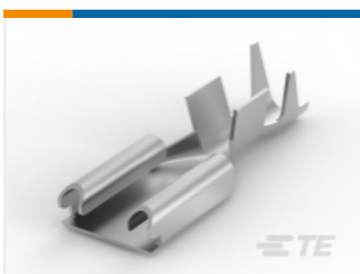
TE 产品编号1-962892-1 FAST STECKHUELSE8,1