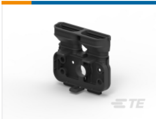
TE 产品编号0528-005-3805 BKSHL, 38P, BLK, PLG, RA, LOW PROFILE