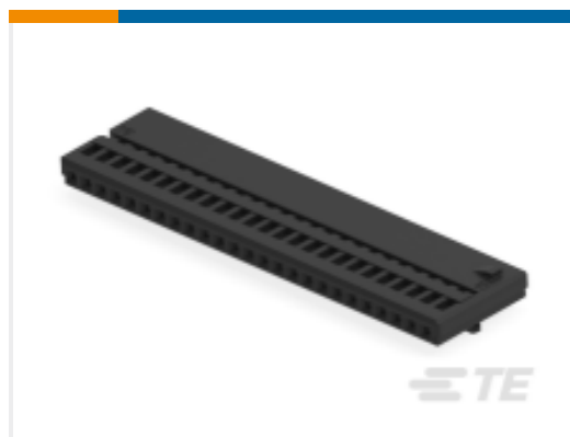
TE 产品编号2324153-2 25POS,MQS,SOCK HSG