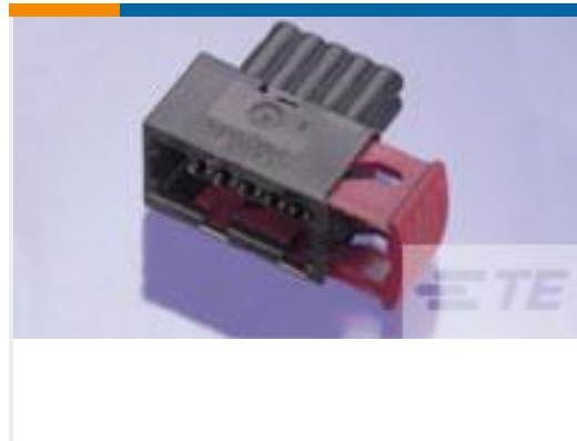
TE 产品编号144998-5 4P JPT CONNECTOR ASSY