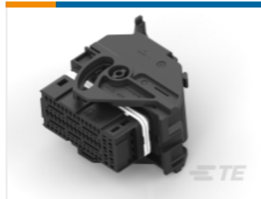
TE 产品编号2050036-4 64P ECU PLUG CONNECTOR