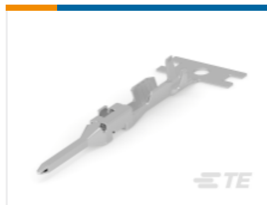
TE 产品编号2385474-1 TAB0.64X0.64,TERMINAL,CB,REM 0.64 UNSEAL