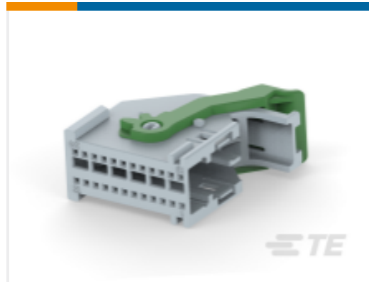
TE 产品编号2209954-2 AIRBAG 24P COVER ASSY