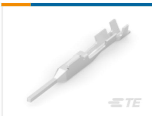
TE 产品编号2411042-1 TAB0.64X0.64,TERMINAL,025 TAB CONTACT