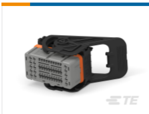
TE 产品编号2299987-4 65W PLUG ASSEMBLY