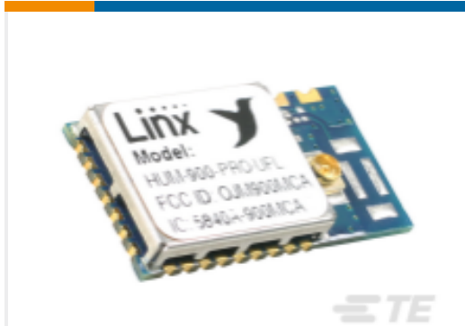
TE 产品编号HUM-900-PRO-UFL Module HUM-PRO 900MHz FHSS FM XCVR FCC