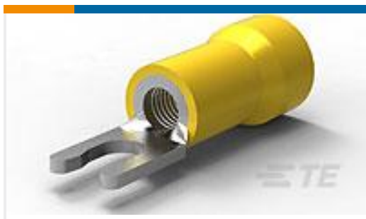
TE 产品编号52961-1 TERMINAL,PG SPR SPD 12-10 6