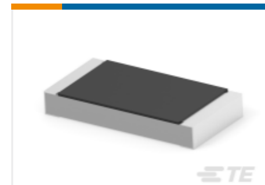
TE 产品编号2-2176608-2 RLC73PD 3A 1R0 1% 1K RL OD