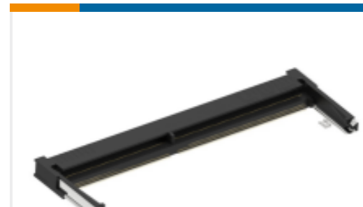
TE 产品编号2309409-1 DDR4 SODIMM 260P 5.2H STD