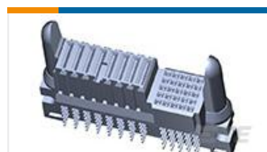
TE 产品编号2-1926739-5 AssyMinipak HdI25s10pRARectpSc