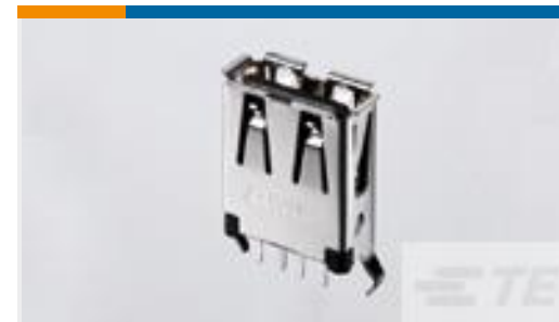
TE 产品编号1734366-3 Std USB Type A, VT, T/H, Blue