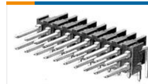
TE 产品编号86479-3 10 MODII HDR DRRA UNSHRD .100