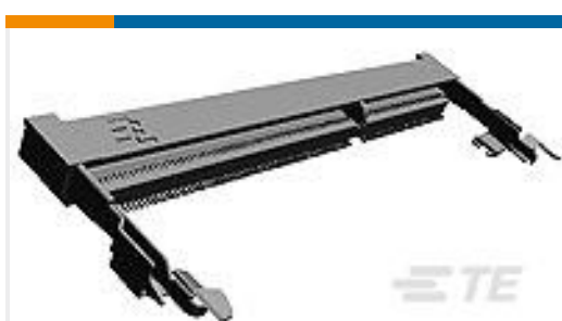
TE 产品编号2013289-1 SEMI-HARD TRAY DDR3 204P 5.2H STD