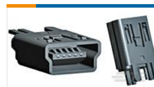
TE 产品编号2041517-1 MINI USB, RCPT,V/T,DIP, B TYPE,30u" Au