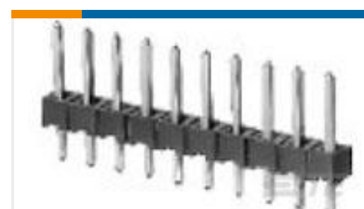
TE 产品编号5-146274-4 04 MODII HDR SRST B/A .100CL