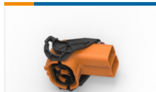
TE 产品编号1-2141154-1 2POS, 8MM HV, REC HSG, 90DEG, ASSY, SEALED