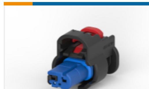
TE 产品编号1-2203769-1 2POS, MCON 1.2 CB REC 1p TL SEALED