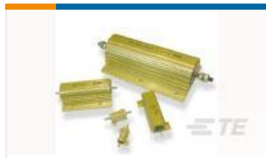
TE 产品编号6-1625984-5 HSA50 50K 5%