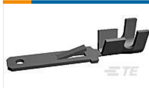
TE 产品编号928947-2 FF 250 TAB 17-13 AWG .016 TPBR