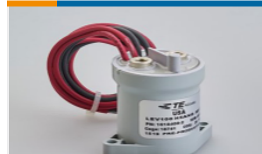
TE 产品编号1618412-8 LEV100H5ANG=CONTACTOR WITH AUX SPST, 15"