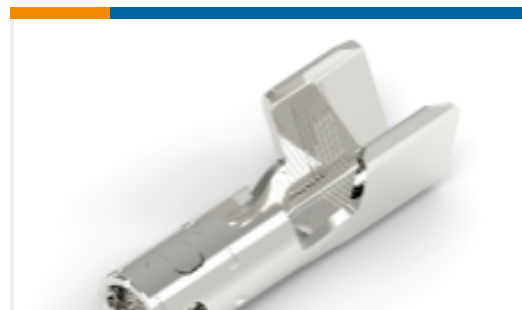
TE 产品编号2208608-3 8MM HV, CONTACT, ASSY