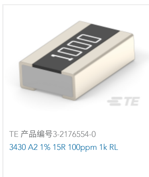
TE 产品编号3-2176554-0 3430 A2 1% 15R 100ppm 1k RL