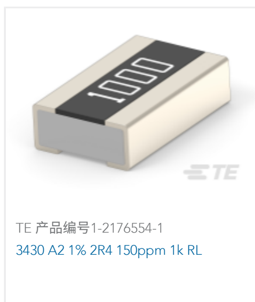
TE 产品编号1-2176554-1 3430 A2 1% 2R4 150ppm 1k RL