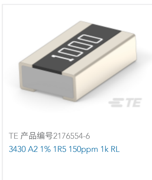
TE 产品编号2176554-6 3430 A2 1% 1R5 150ppm 1k RL