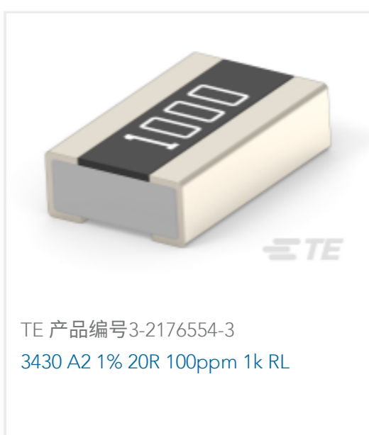
TE 产品编号3-2176554-3 3430 A2 1% 20R 100ppm 1k RL