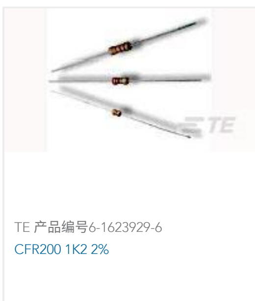
TE 产品编号6-1623929-6 CFR200 1K2 2%