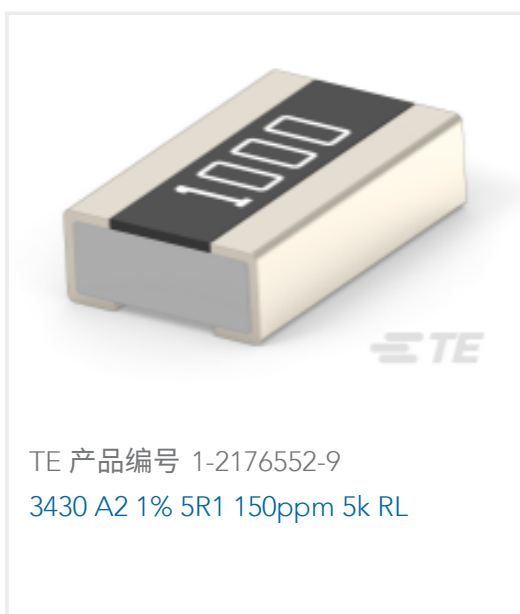
TE 产品编号 1-2176552-9 3430 A2 1% 5R1 150ppm 5k RL