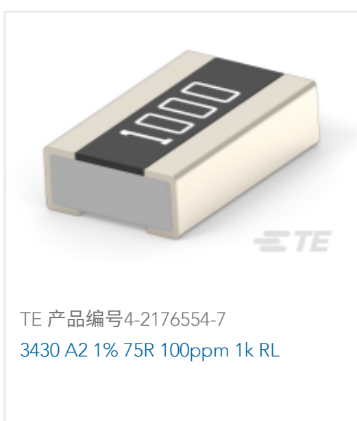
TE 产品编号4-2176554-7 3430 A2 1% 75R 100ppm 1k RL