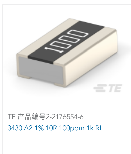
TE 产品编号2-2176554-6 3430 A2 1% 10R 100ppm 1k RL