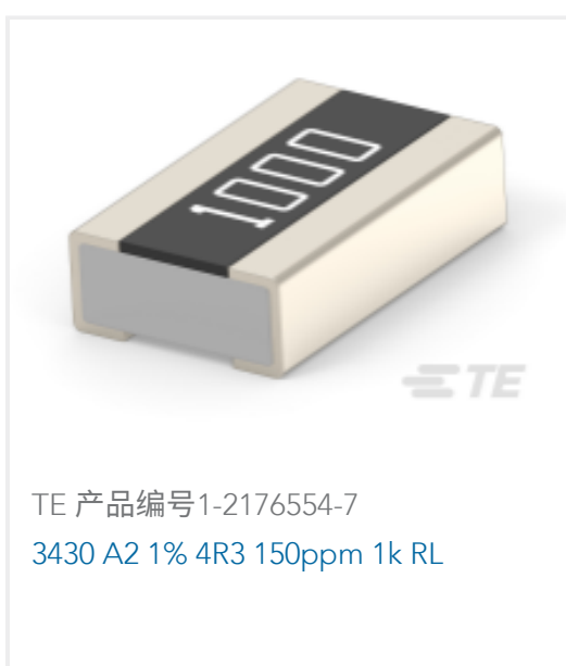
TE 产品编号1-2176554-7 3430 A2 1% 4R3 150ppm 1k RL