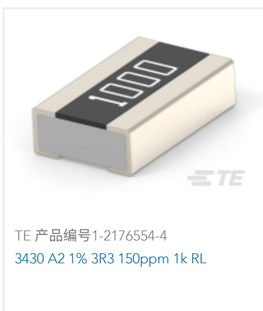
TE 产品编号1-2176554-4 3430 A2 1% 3R3 150ppm 1k RL