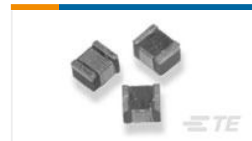
TE 产品编号9-1624112-2 3650 0603 0.27uH 5% 2K RL