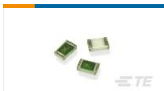
TE 产品编号7-2176087-8 RP 1J 0.166W 442R 0.1% 25PPM 1K RL