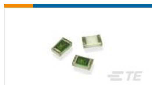
TE 产品编号2176088-8 RP 1J 0.166W 887R 0.1% 25PPM 1K RL