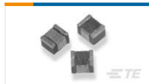
TE 产品编号1624112-5 3650 0603 33nH 5% 2K RL