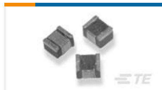
TE 产品编号1624112-2 3650 0603 12nH 5% 2K RL