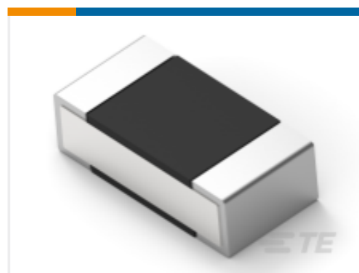
TE 产品编号7-2176305-3 RP 1E 0.1W 604R 0.1% 25PPM 5K RL