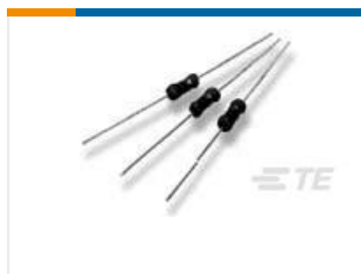
TE 产品编号7-1879354-5 RR03 5% 390R AMMO