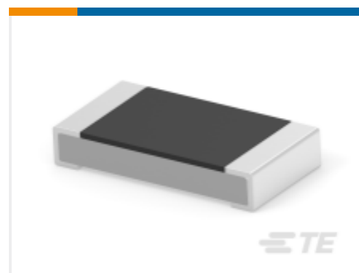
TE 产品编号2-2176392-9 RQ 1206 261K 0.1% 10PPM 5K RL