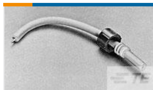
TE 产品编号1-830611-0 LGH 1/2 SNGL MLD END