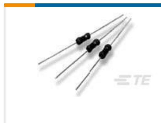
TE 产品编号1-1879353-9 RR02 5% 24K AMMO