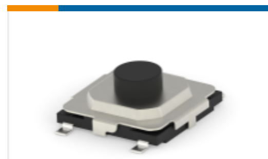
TE 产品编号2337238-3 TACT MINI GW 5.2X5.2X2 160GF