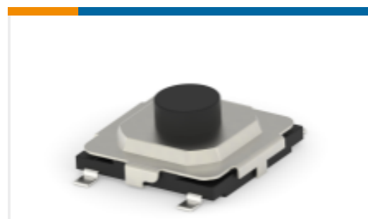
TE 产品编号2337238-3 TACT MINI GW 5.2X5.2X2 160GF