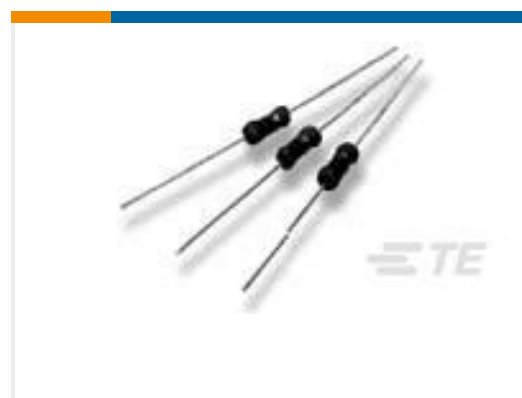
TE 产品编号1-1879353-9 RR02 5% 24K AMMO