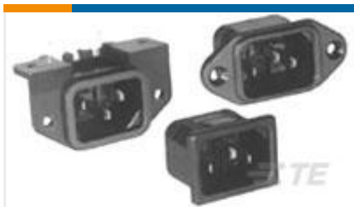
TE 产品编号1609133-4 6ESRMC2=F6989