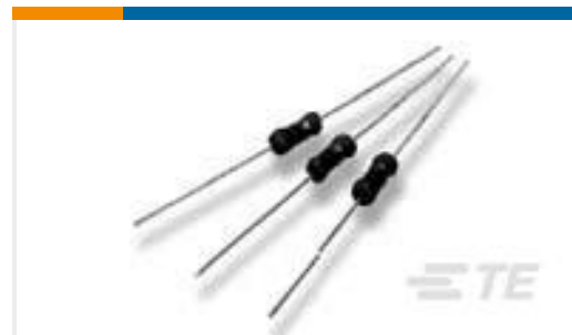
TE 产品编号4-1625892-3 3W SM M/OX 5% 33R