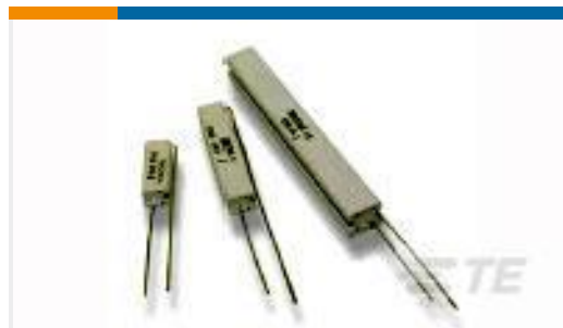
TE 产品编号1623728-9 BCHE 11 W 1R0 10%