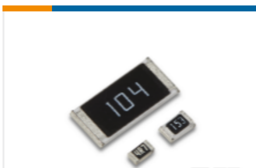
TE 产品编号4-2176343-5 CRGCO 1206 47K 1%