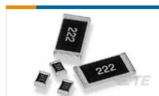
TE 产品编号2-1676480-2 CRG0402 1% 1K0