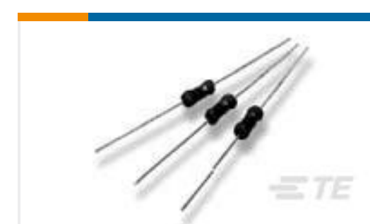
TE 产品编号3-1625885-0 1W SM M/OX 5% 18R