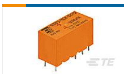
TE 产品编号1-1415899-1 RZ01-1C4-D024