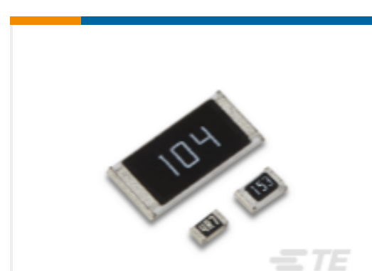
TE 产品编号6-2176337-1 CRGCQ 0402 1M0 1%