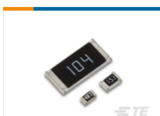
TE 产品编号3-2176337-8 CRGCQ 0402 12K 1%