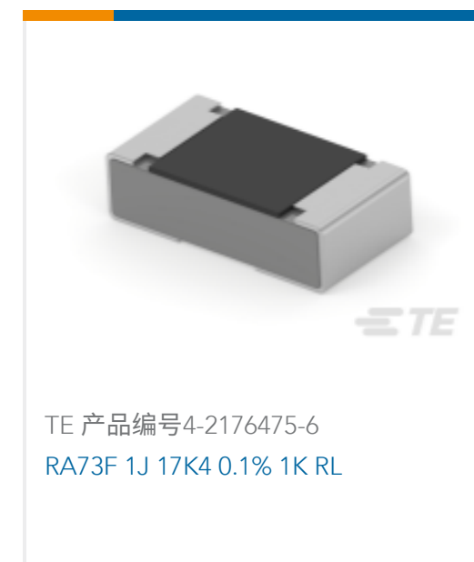
TE 产品编号4-2176475-6 RA73F 1J 17K4 0.1% 1K RL