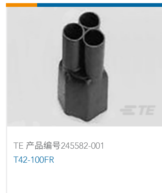
TE 产品编号245582-001 T42-100FR