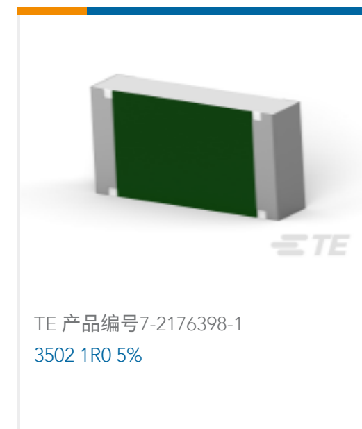
TE 产品编号7-2176398-1 3502 1R0 5%