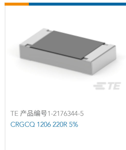
TE 产品编号1-2176344-5 CRGCQ 1206 220R 5%