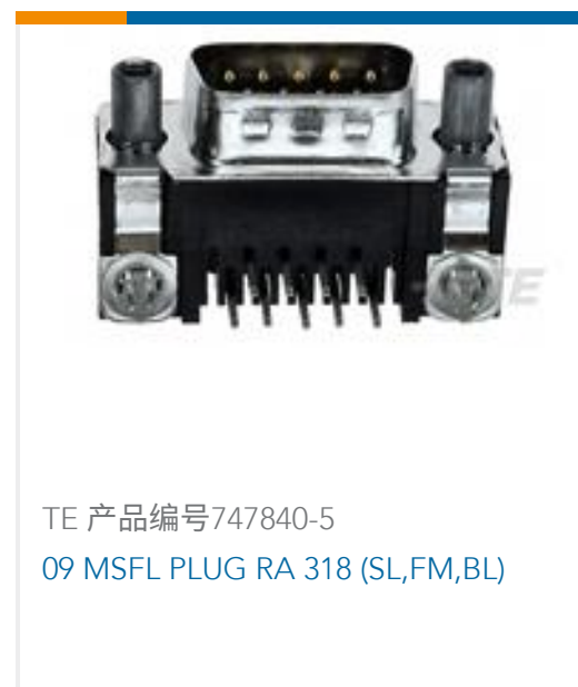
TE 产品编号747840-5 09 MSFL PLUG RA 318 (SL,FM,BL)