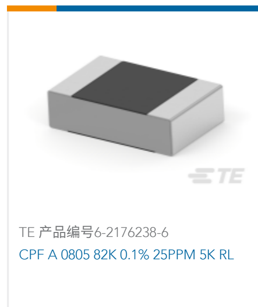
TE 产品编号6-2176238-6 CPF A 0805 82K 0.1% 25PPM 5K RL