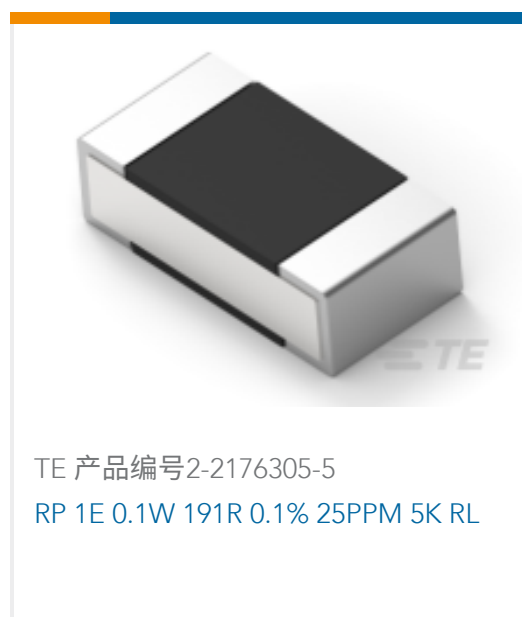
TE 产品编号2-2176305-5 RP 1E 0.1W 191R 0.1% 25PPM 5K RL