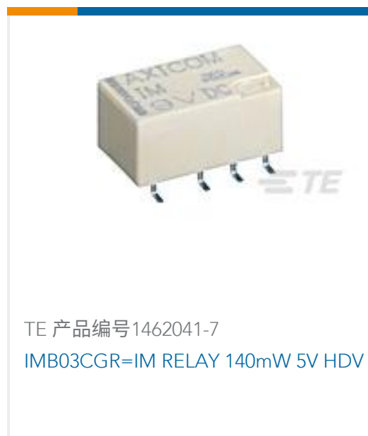
TE 产品编号1462041-7 IMB03CGR=IM RELAY 140mW 5V HDV