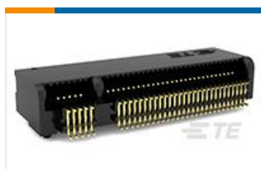
TE 产品编号2199230-4 M.2 0.5PITCH 4.2H KEY E 15U" AU