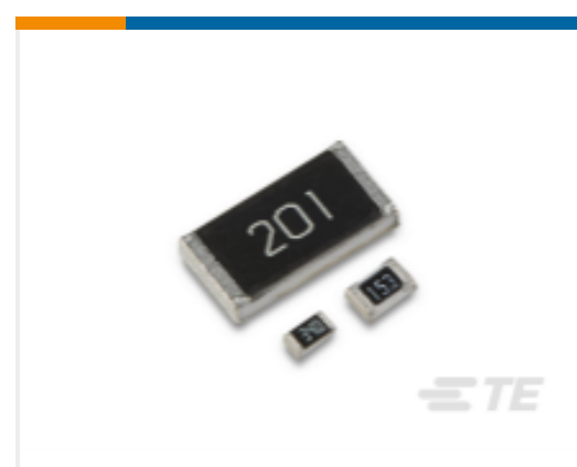
TE 产品编号1-2176325-9 CRGP 0402 330R 1%