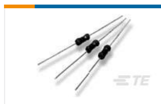
TE 产品编号1-1625892-3 3W SM M/OX 5% 12R