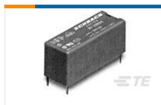
TE 产品编号4-1393224-9 RY211024