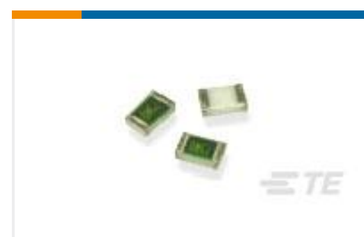
TE 产品编号2176093-1 RP 2A 0.25W 9K09 0.1% 25PPM 1K RL