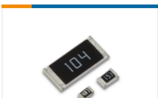
TE 产品编号3-2176339-3 CRGCQ 0603 4K7 1%