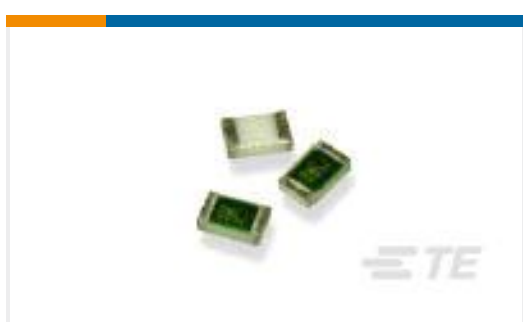
TE 产品编号2-1676481-8 CPF 0603 68R 0.1% 25PPM 1K RL