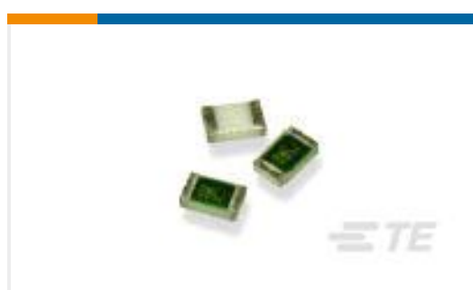
TE 产品编号3-1676481-9 CPF 0603 220R 0.1% 25PPM 1K RL