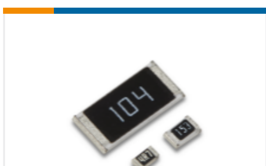
TE 产品编号2-2176339-1 CRGCQ 0603 470R 1%