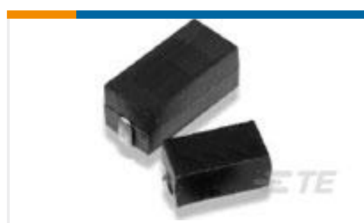
TE 产品编号2-1676966-5 SMW2 1R0 5%