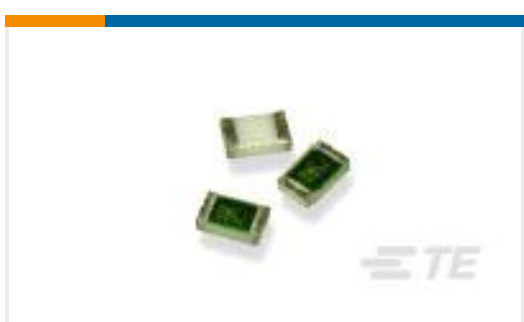
TE 产品编号1879337-6 CPF 0603 2K8 1% 50PPM 1K RL