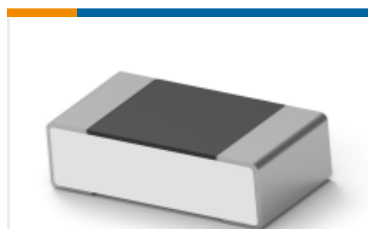
TE 产品编号2-2176371-4 RQ 0603 8K06 0.1% 10PPM 5K RL