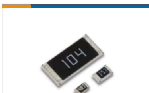
TE 产品编号1-2176339-7 CRGCQ 0603 220R 1%