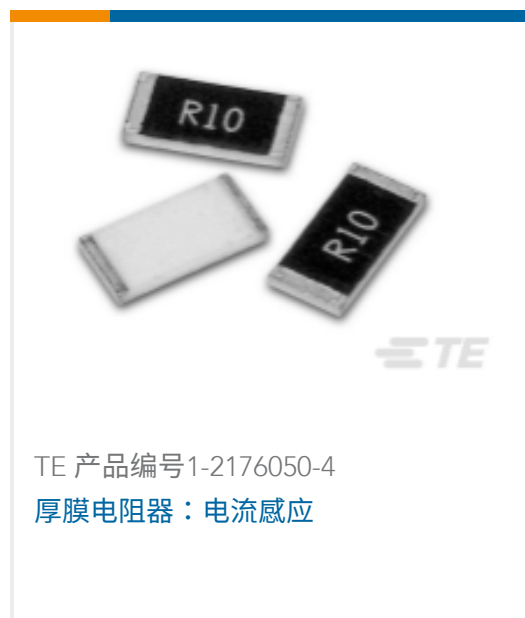
TE 产品编号1-2176050-4 厚膜电阻器：电流感应