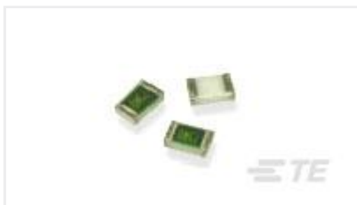
TE 产品编号6-2176087-2 RP 1J 0.166W 301R 0.1% 25PPM 1K RL