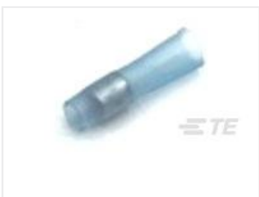
TE 产品编号625006-000 D-136-21