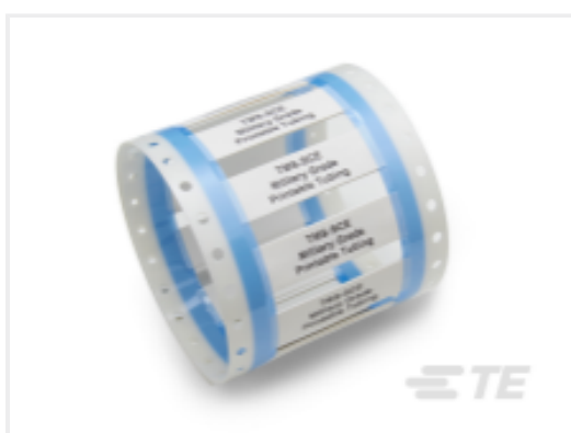
TE 产品编号CAT-T3437-T548 TMS-SCE Military Grade Sleeves