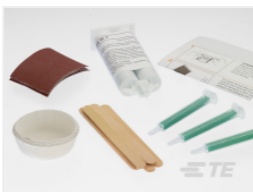
TE 产品编号657863-000 S1125-KIT-8