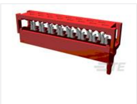
TE 产品编号1-215083-0 MICRO-MATCH MOW.10P