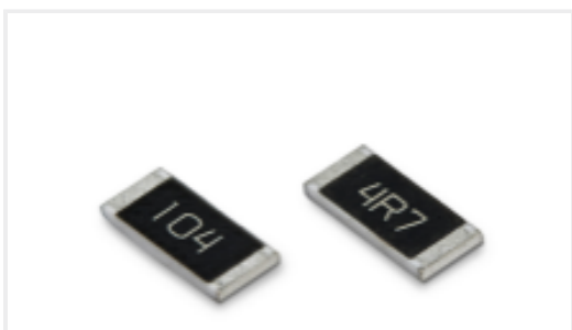
TE 产品编号1-2176456-7 CPF 0603 1R47 0.1% 25ppm 1K RL