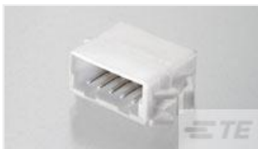
TE 产品编号292254-6 CT RELAY HDR ASSY 6P NAT