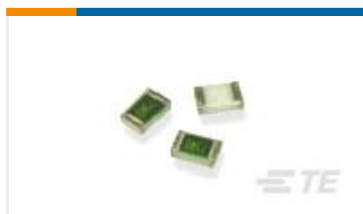
TE 产品编号3-2176090-6 RP 1J 0.166W 301K 0.1% 25PPM 1K RL