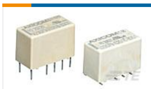
TE 产品编号1393788-3 V23079A1001B301