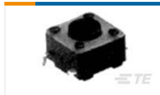
TE 产品编号1977223-6 FSM2JSMASTR=6MM TACT SWITCH,