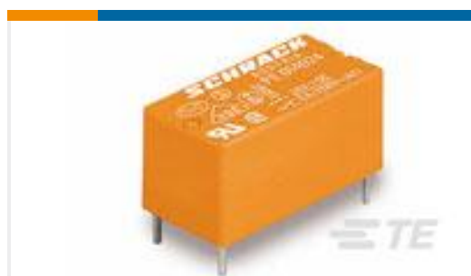
TE 产品编号1393219-3 PE014005