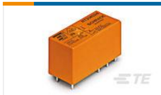
TE 产品编号3-1419108-8 RTD34024