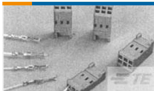
TE 产品编号188744-1 CONTACT REC HE14 COSI TIN PLATED