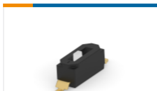
TE 产品编号2-2319847-2 END STACK DIP 1P G RAISED T&R