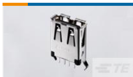
TE 产品编号1734366-1 Std USB Type A, VT, T/H