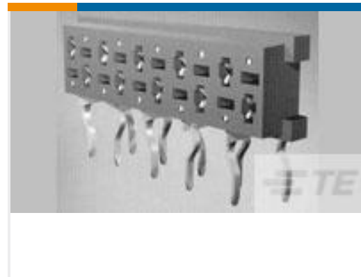
TE 产品编号 1-100400-8 MICRO-MATCH FSID NP