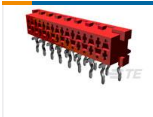
TE 产品编号 8-215460-8 MICRO-MATCH FSID P