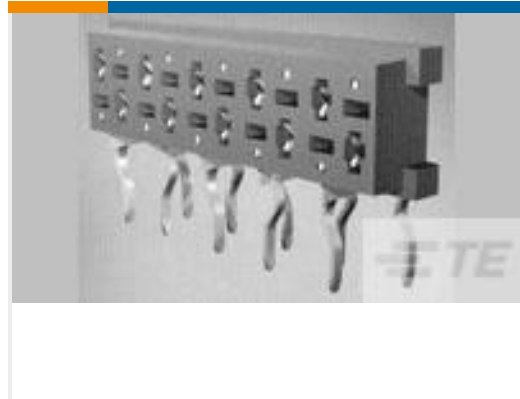
TE 产品编号 8-100400-8 MICR-MATCH FSID NP