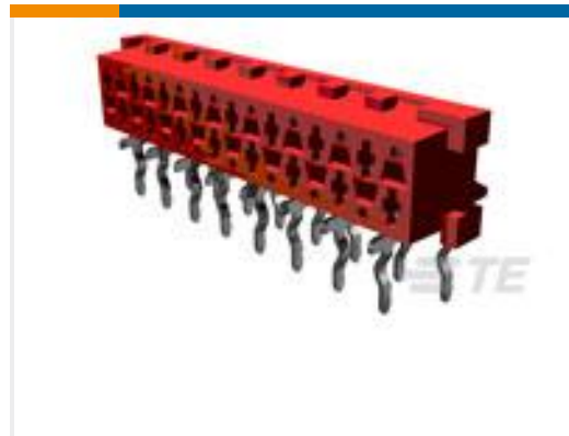
TE 产品编号 1-215460-8 MICRO-MATCH FEM.SE