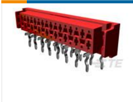
TE 产品编号 1-338070-8 MICRO-MATCH FEM.SE